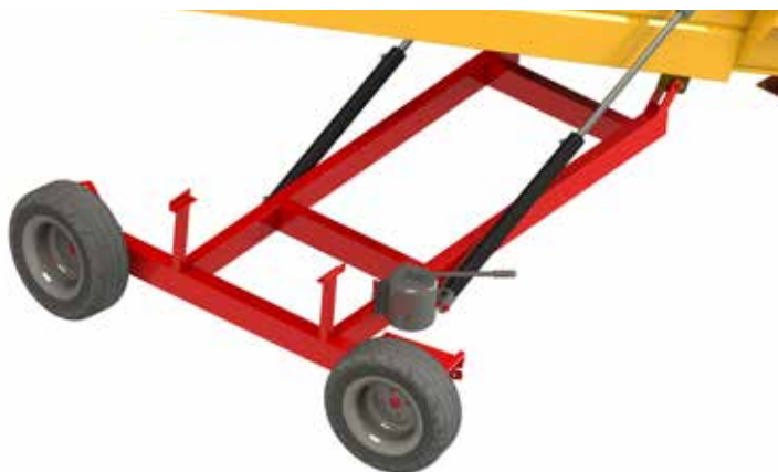
Optie: draaibare wielen aan de basis