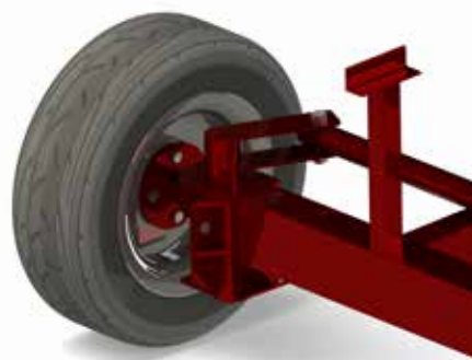
Optie: hydraulische cilinder om de wielen dwars te plaatsen