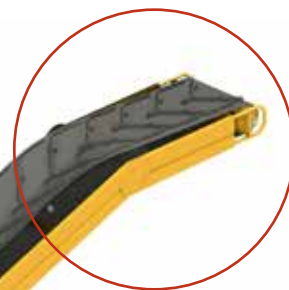
Optie: verstelbare knik (zwanenhals)