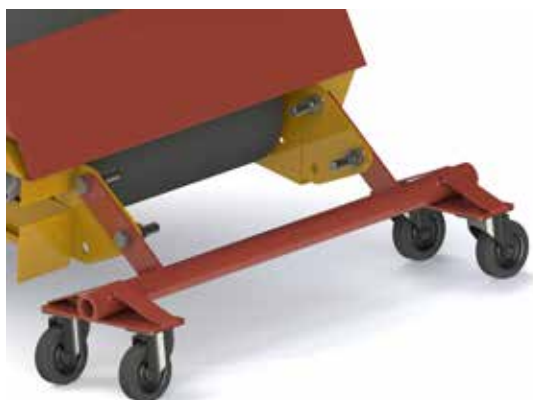
Optie: zwenkwielen met pivot aan de ingang